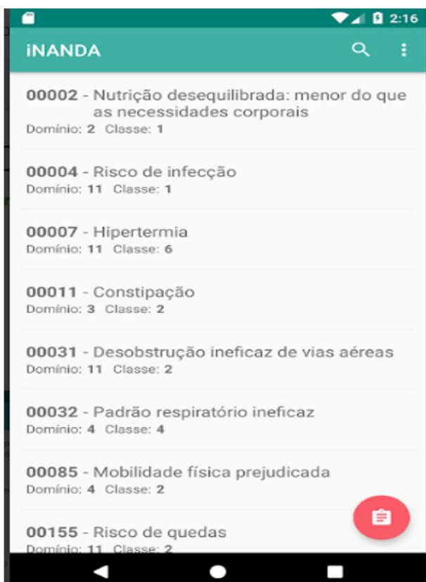
Figura 1 – Tela inicial

Na Figura 4 é apresentado o resultado de uma consulta realizada por meio das características definidoras.