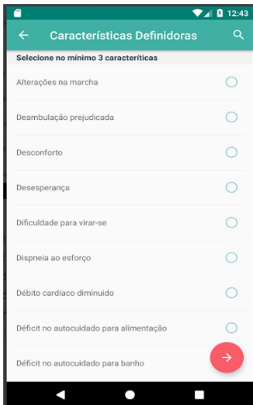
Figura 3 – Tela com as características definidoras