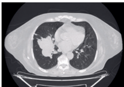
Figura 3 - Janela de parênquima pulmonar no plano transversal da TC de tórax

A partir do resultado obtido, o principal objetivo foi encontrar o tumor primário causador da metástase. O primeiro exame solicitado com essa finalidade foi a Tomografia Computadorizada do tórax, onde foi encontrado um suposto foco primário no pulmão direito da paciente (Figura 3).