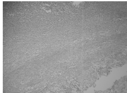
Figura 2 – Aspecto microscópico da presença de trofoblasto.