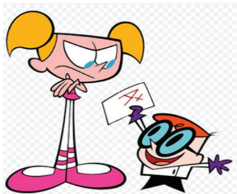
Recorte 1: Dee Dee

Dee Dee é representada, nos episódios, como uma garota curiosa, ingênua e desengonçada, representação imaginária esta que se materializa iconicamente no modo como ela é desenhada, ou seja, pelo traço (traçado) é possível depreender o modo como a garota é significada na trama discursiva da referida animação. Com uma desproporção corporal peculiar, ela é duas a três vezes mais alta que Dexter, tem torso pequeno e uma cabeça grande e suas pernas são longas e finas, como é possível observar no recorte 1 abaixo: