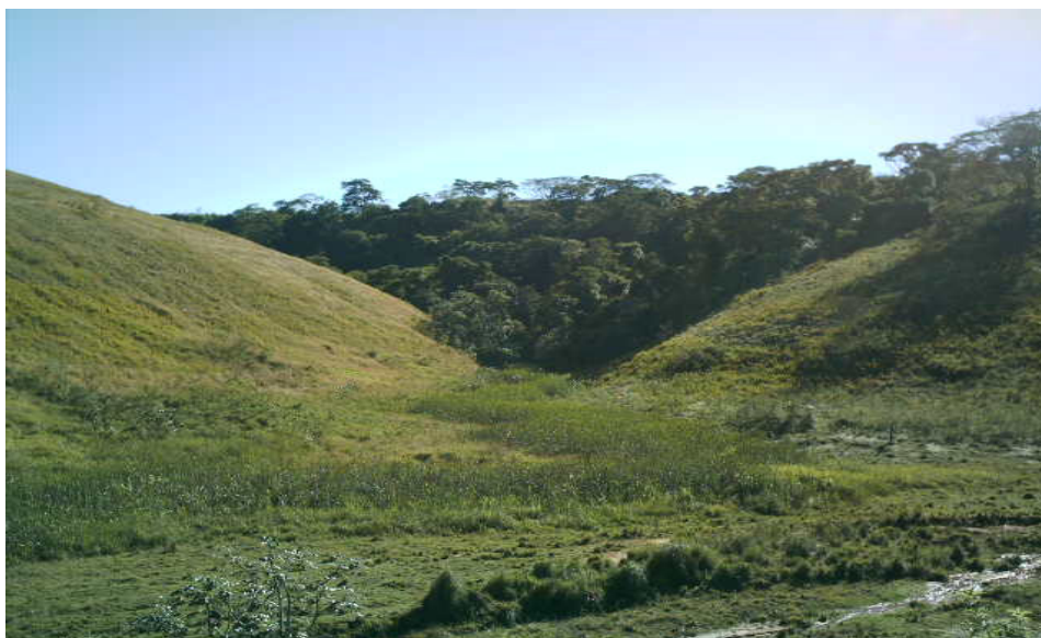
Figura 03- Nascente do Matão