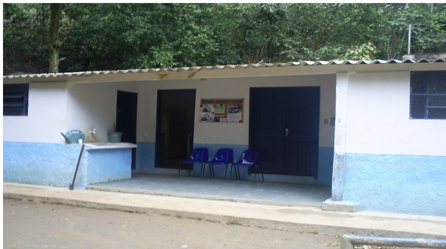
Figura 02- Vista parcial da Sede da APA Barra do Pirai