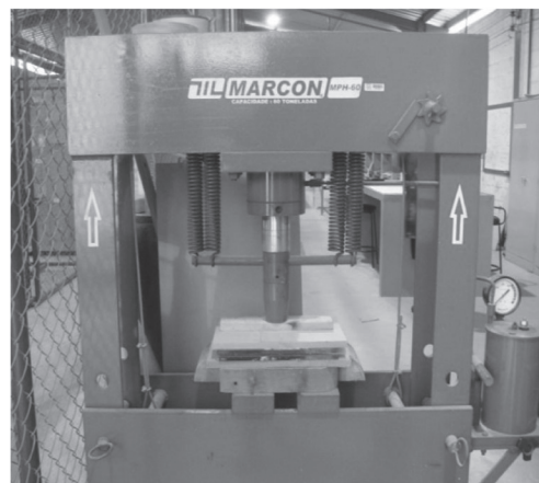
Figura 1. Processo utilizado para obtenção do laminado.

O processamento dos laminados foi feito utilizando moldagem por compressão sob 1,5 toneladas por 1 minuto, conforme Figura 1.